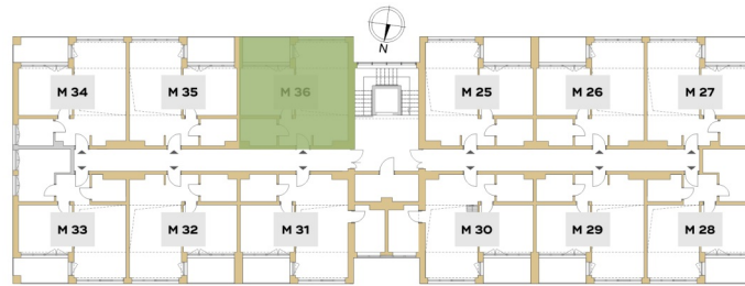
Rzut piętra budynku z lokalizacją mieszkania.