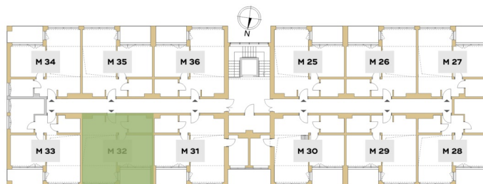
Rzut piętra budynku z lokalizacją mieszkania.