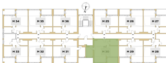
Rzut piętra budynku z lokalizacją mieszkania.